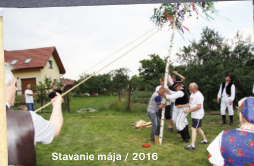
Stavanie mája / 2016