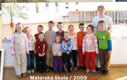
Materská škola / 2009