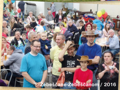
Žebeščane-Žebeščanom / 2016