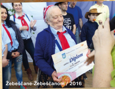
Žebeščane-Žebeščanom / 2016