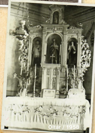
Oltár / 1958