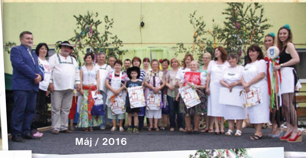
Máj / 2016