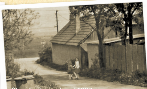
Starý Fortunov dom / 1987