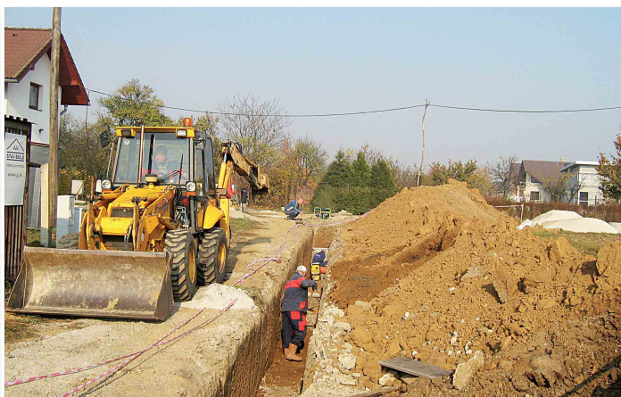
Výstavba inžinierskych sietí v lokalite - Nadmerné záhrady