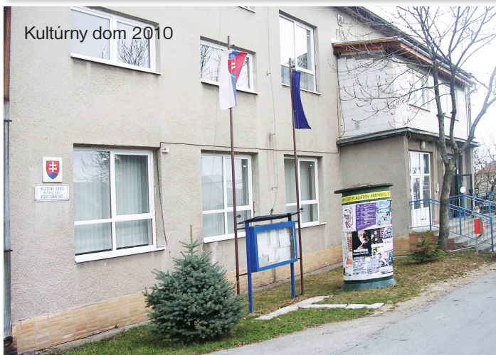
Kultúrny dom 2010