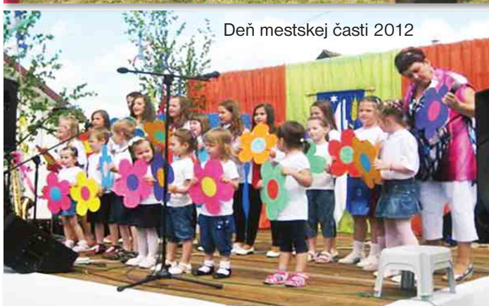
Deň mestskej časti 2012