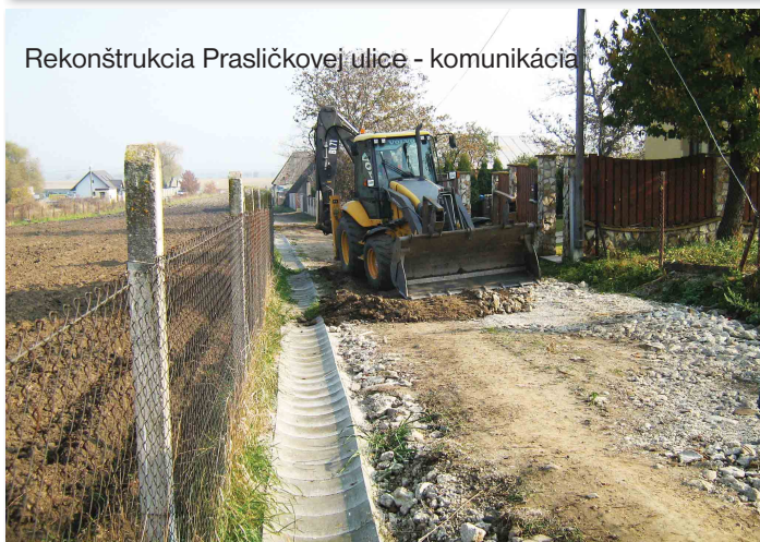
Rekonštrukcia Prasličkovej ulice - komunikácia