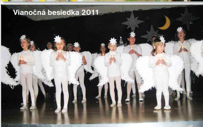
Vianočná besiedka 2011