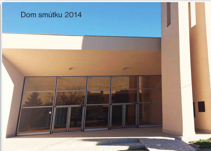
Dom smútku 2014