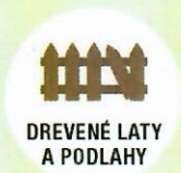
DREVENÉ LATY A PODLAHY