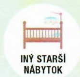
INÝ STARŠÍ NÁBYTOK